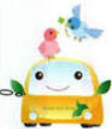
エコドライブキャラクター 「エコ丸くん」