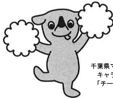
千葉県マスコット キャラクター 「チーバくん」