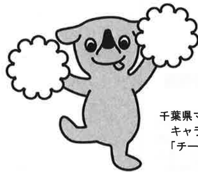
千葉県マスコット キャラクター 「チーバくん」